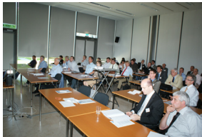
Juni 2009 Karlsruhe