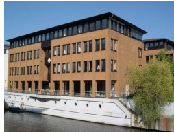
September 2009 Hamburg

Die letzten RemoteServiceForen fanden statt bei: eps/Siemens, KSB, KBA, EMAG, Hirschmann, IHK-Karlsruhe, Print Media Academy Heidelberg.